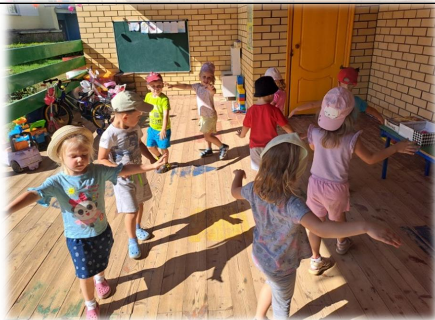
Игра «Мебель для куклы»